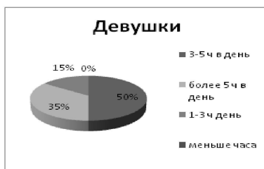
Рис. 1: Показатели затрат времени в день на времяпровождение в социальных сетях юношами и девушками (17-22лет)