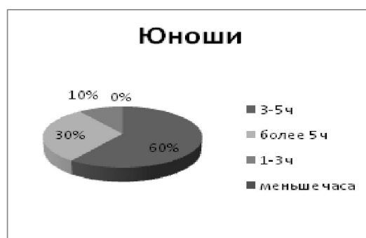
Рис. 2: Показатели затрат времени в день на времяпровождение в социальных сетях юношами и девушками (17-22лет)