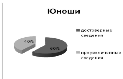
Рис. 9: Состояние мотивации самоутверждения и аффилиации у юношей и девушек (17-22лет)