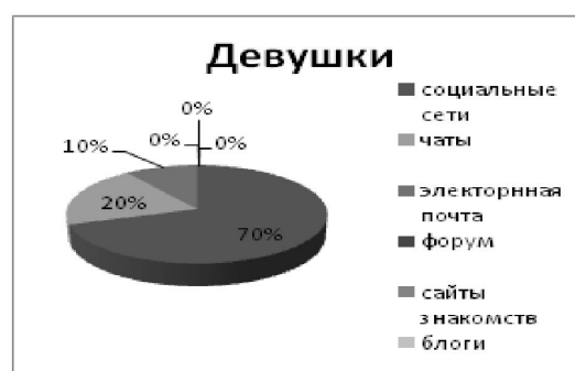
Рис. 5: Мотивы использования социальных сетей для общения юношами и девушками (17-22лет)