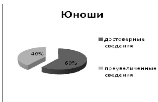
Рис. 8: Состояние мотивации самоутверждения и аффилиации у юношей и девушек (17-22лет)