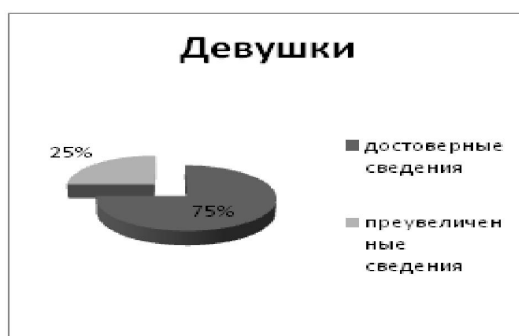
Рис. 7: Состояние мотивации самоутверждения и аффилиации у юношей и девушек (17-22лет)