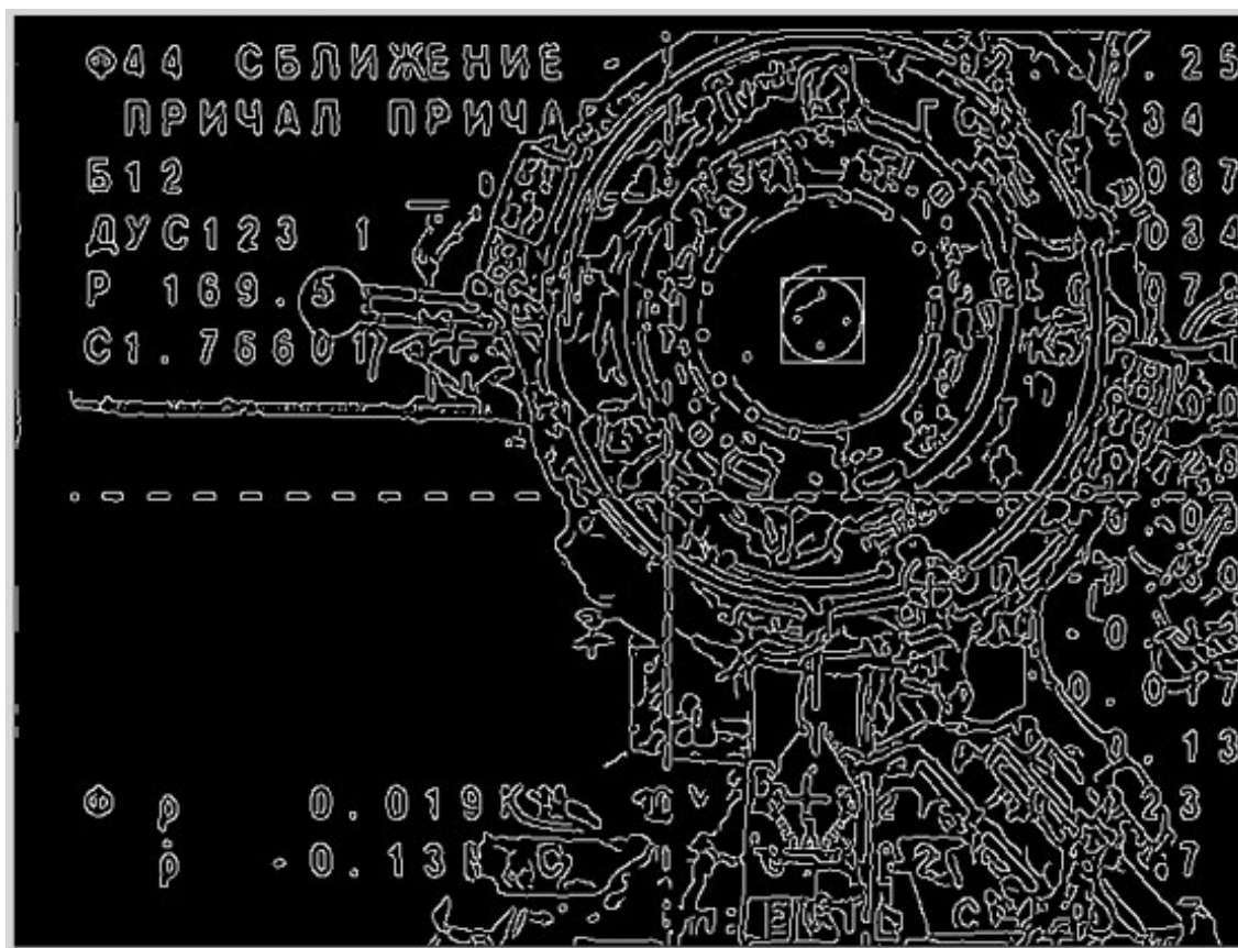
Рис. 2: карта краёв предыдущего изображения