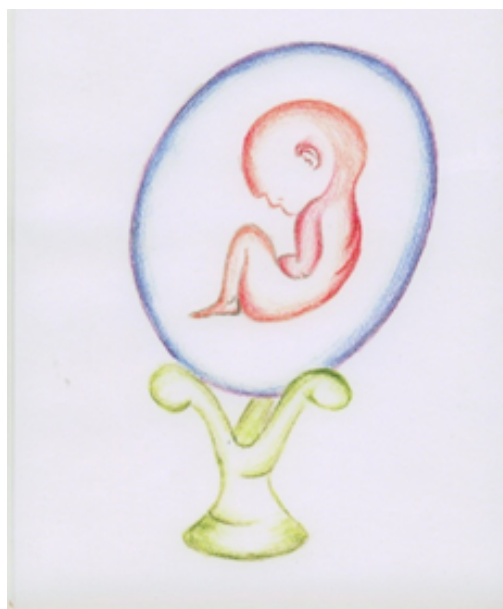
Рис. 3: Мои ощущения