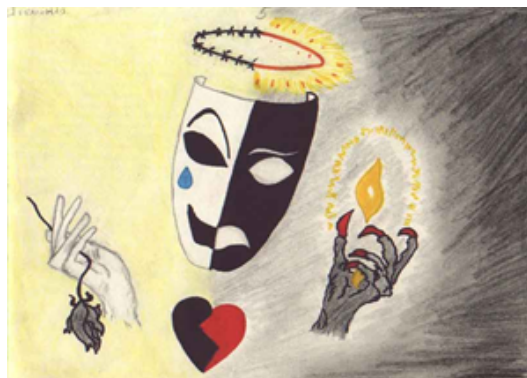
Рис. 1: Я-реальное, я-идеальное