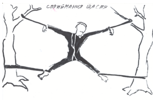
Рис. 2: Восприятие счастья