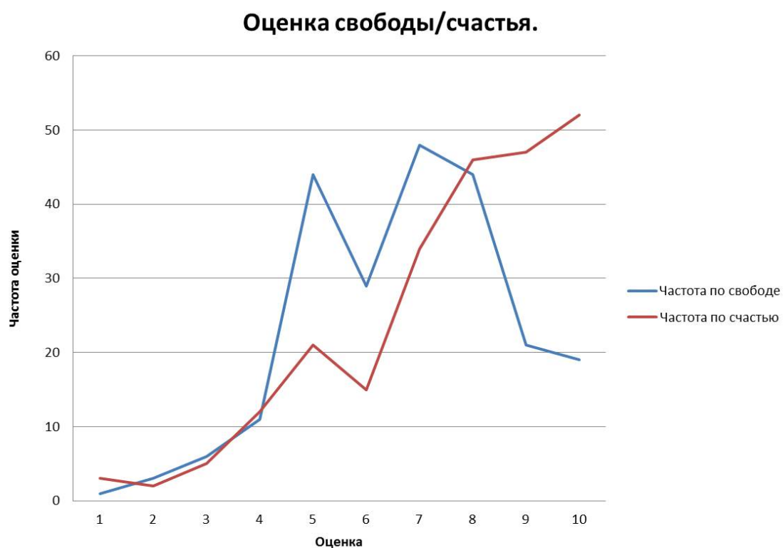
Рис. 2: График "Оценка свободы/счастья"