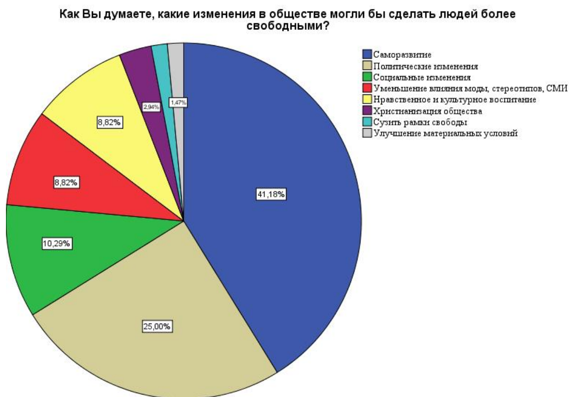
Рис. 3: Диаграмма "Факторы, влияющие на развитие свободы в обществе"