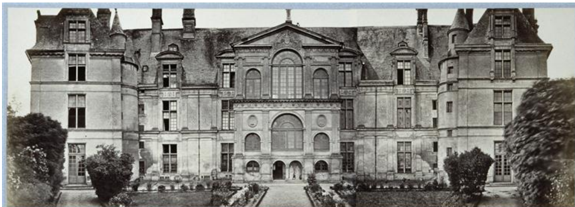
Рис. 4. Северный фасад замка Экуан