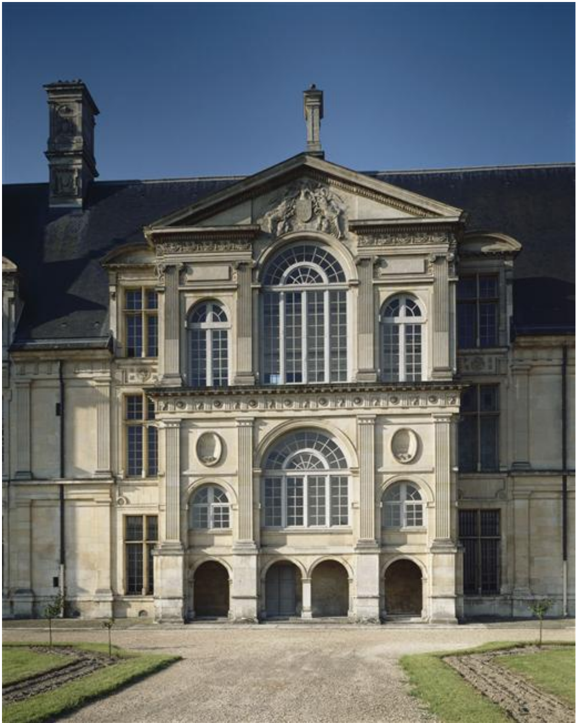
Рис. 1. Внешний портик Северного Фасада Дворца Экуан