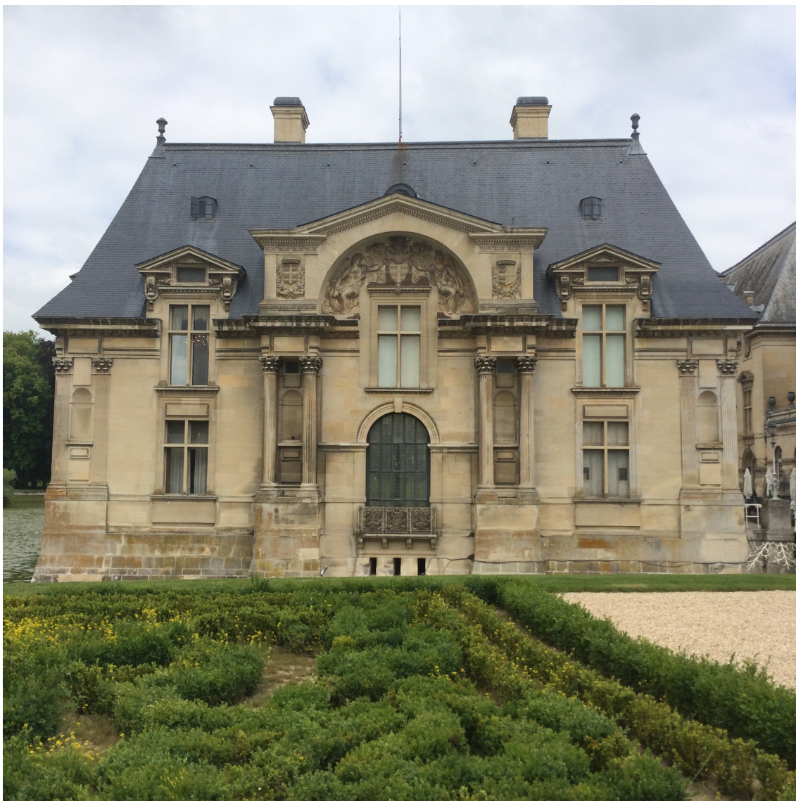
Рис. 10. Малый замок Шантйи