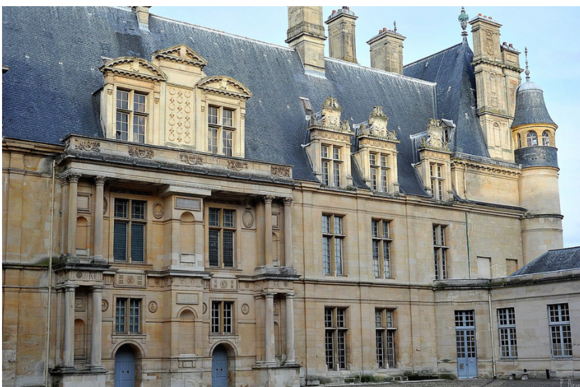
Рис. 5. Северный фасад двора замка Экуан