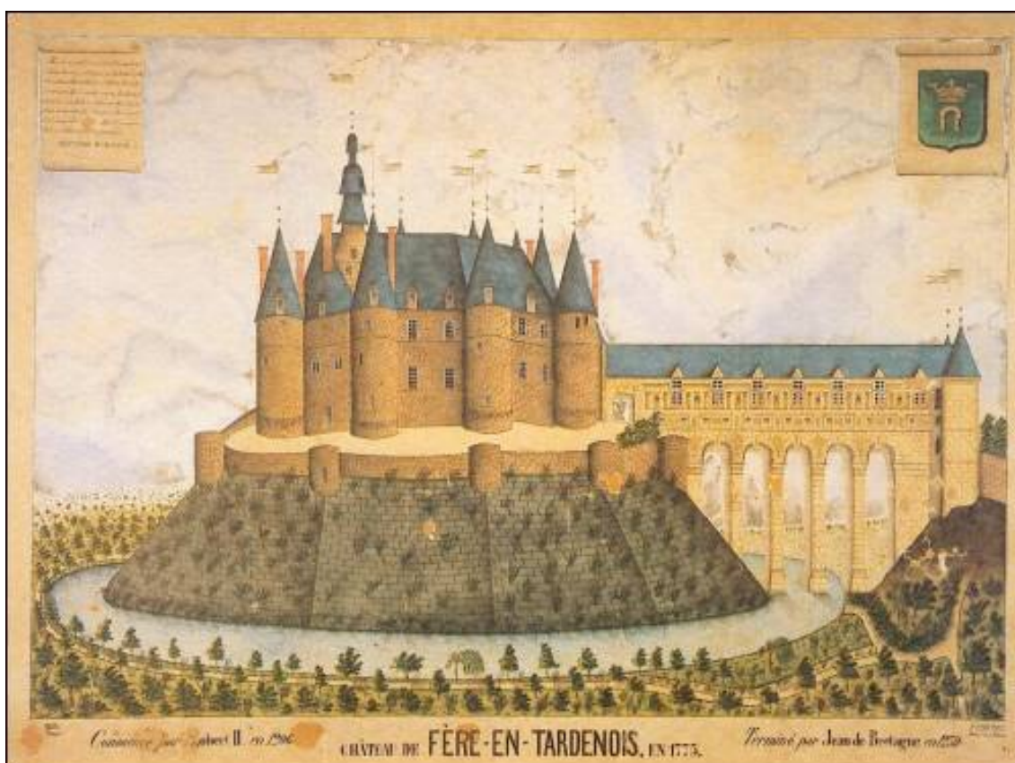
Рис. 9. Фер-ан-Тарденуа на гравюре XVIII века