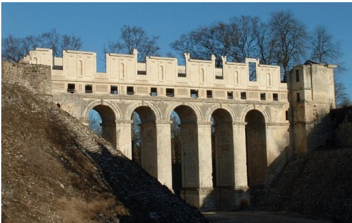
Рис. 7. Мост-Галерея Фер-ан-Тарденуа