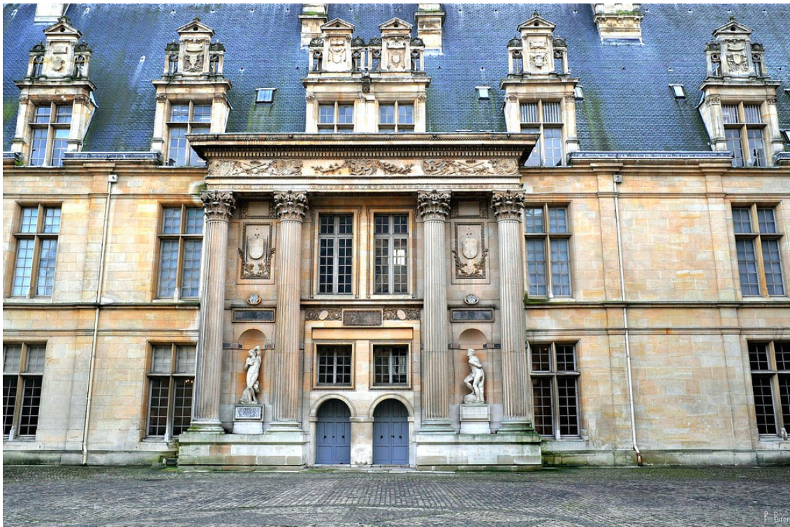
Рис. 6. Южный фасад двора замка Экуан