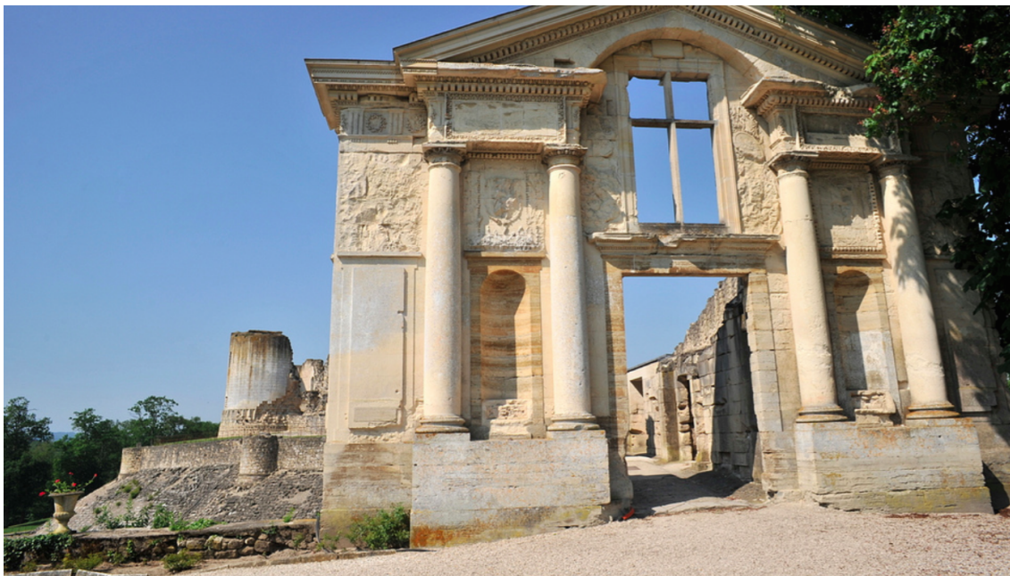
Рис. 8. Порттик моста-галереи Фер-ан-Тарденуа