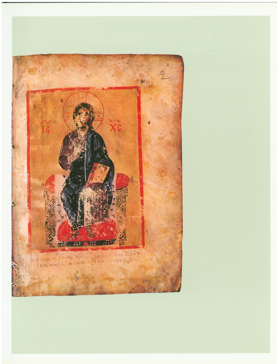
Рис. 2. Иисус Христос. Четвероевангелие . РГБ, ф 270 Ia, № 8, л.2. Воспр. по изд.: Лихачева В. Д. Византийские миниатюры. М.,1977