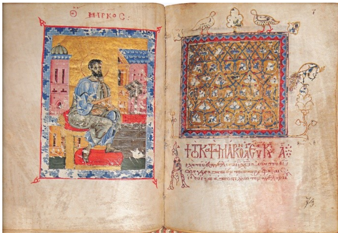
Рис. 1. Евангелист Марк и заставка к евангелию от Марка. Четвероевангелие. РГБ, ф 304, III (бывш гр. 11) л.72 об. -73. Воспр. по изд. Древности Афона X-XVII вв.