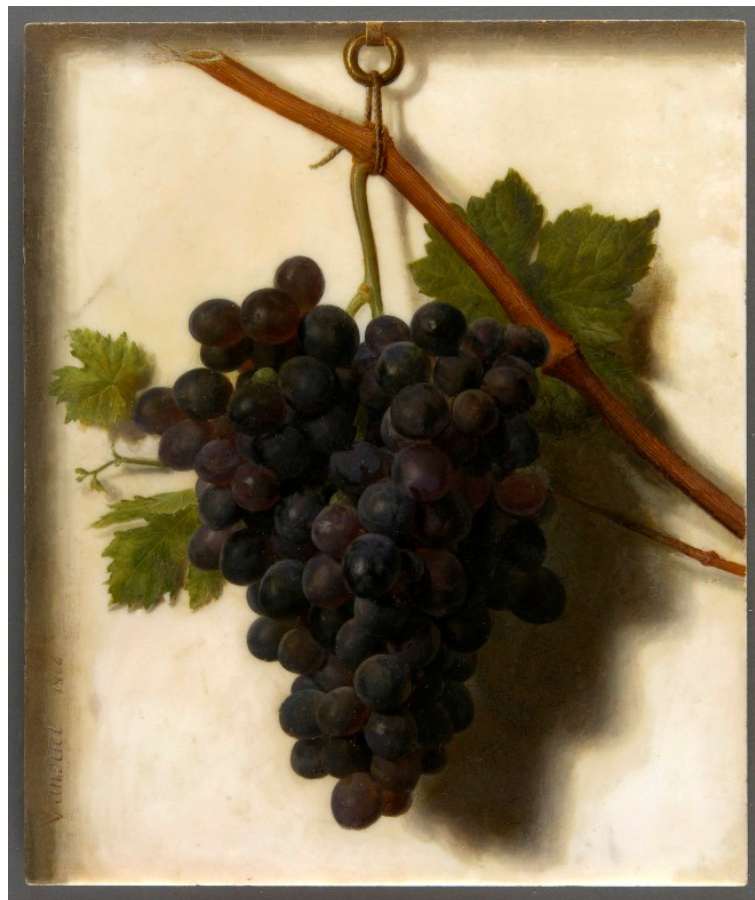
Рис. 3. Ж.Ф. Ван Даль. Натюрморт с виноградной гроздью. 1806 г., мрамор, масло, 32x27 см. Общий вид после реставрации.