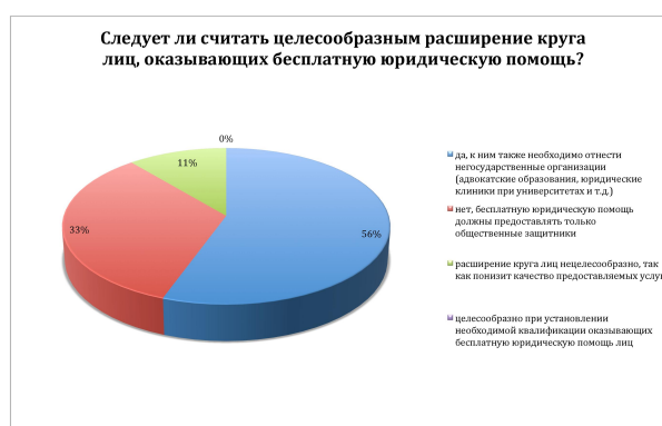
Рис. 2. График 2