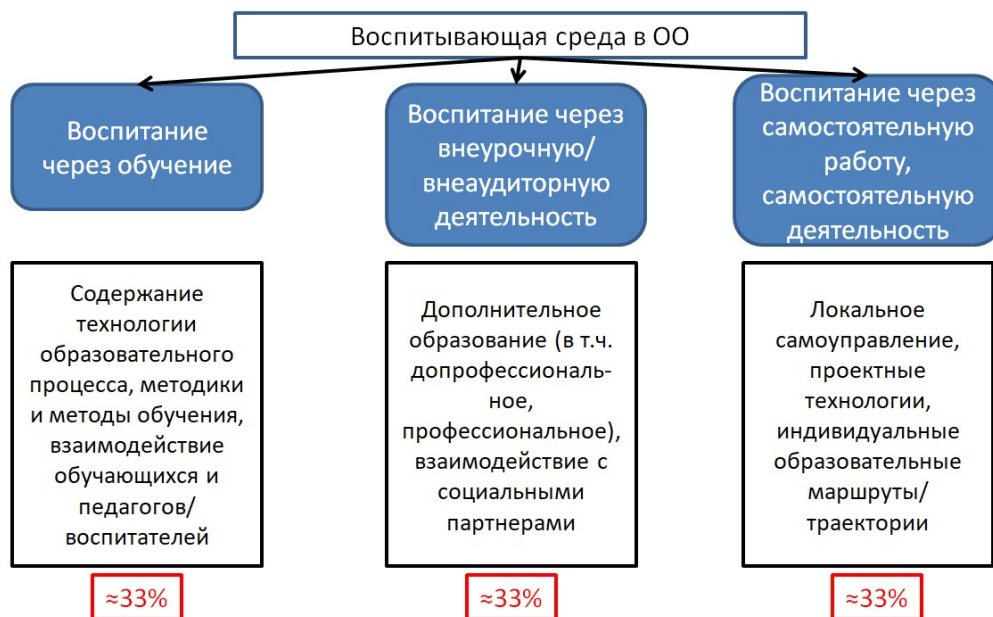
Рис. 1. Существующая модель воспитывающей среды в образовательных организациях